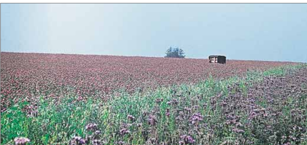
Großer Rotklee Schlag mit breitem Phacelia-Randstreifen. Im Hintergrund: ein Bienenstand.

Links: Innenfütterung: Die am Vorabend zubereitete Futterlösung wird den Versuchsvölkern als Duftlauge, den Kontrollvölkern als einfache Zuckerlösung 1 : 1 im Seitenwand-Futtertrog gereicht.