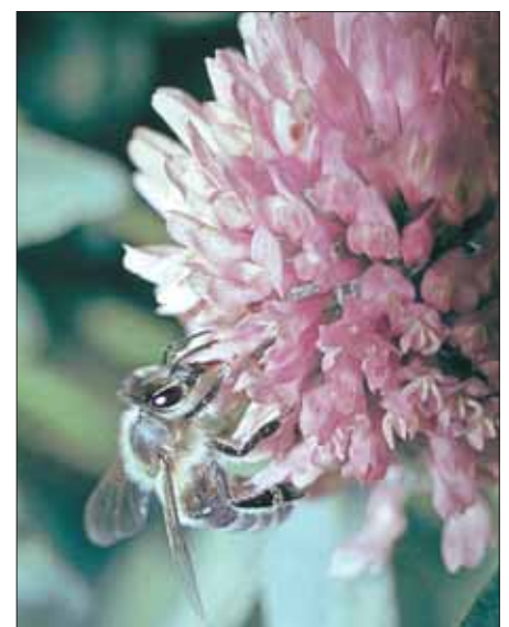
Eine Carnica-Biene ( Apis mellifera carnica ) beim „rechtmäßigen“ Blütenbesuch.