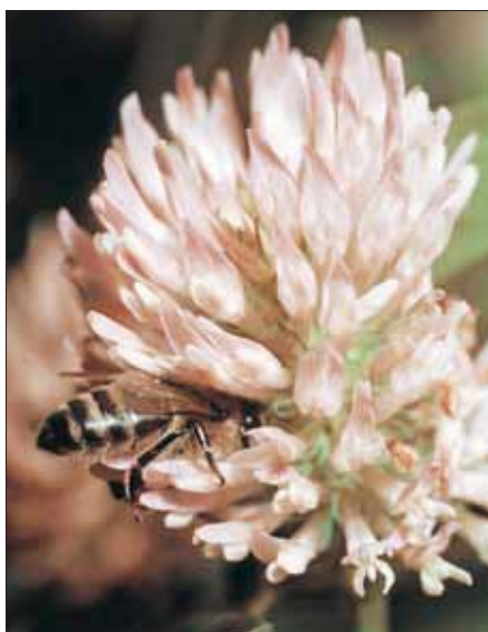
Die Dunkle Biene ( Apis mellifera mellifera ) nutzt Hummel-Bisslöcher zur Entnahme von Nektar.

Auf Grund der positiven Resultate, mit denen die Ergebnisse früherer Autoren (von Frisch, von Rhein) bestätigt wurden, gab das Landwirtschaftsministerium über die Zentrale Landwirtschaftsausstellung „agra“ und die VVB Saat- und Pflanzgut Empfehlungen heraus, die den Saatzbetrieben im Rahmen des vertraglichen Bestäubungseinsatzes von Bienenvölkern besonders bei Rotklee auch die Duftlen-