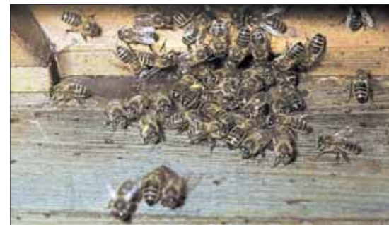
Zwei gelb gezeichnete Bienen (je 1 Biene heimkehrend und vor dem Abflug).

Einen entscheidenden Fortschritt brachte erst die Erkenntnis, dass wirkliche Erfolge im Rotklee sowohl bezüglich des Saatguts als auch des Honigertrags nur mit länger-rüsseligen Bienen wie der Carnica-Biene zu erzielen sind. So verlangten einerseits die Saatbaubetriebe zunehmend nach Carnica-Imkern als Vertragspartner; andererseits waren vorwiegend Imker mit Carnica-Völkern an der Wanderung in den Rotklee interessiert, denn vor allem sie konnten mit einer Honigernte aus der Rotkleeblüte rechnen. Man kann durchaus die These vertreten, dass es mit dem nun schnell sich ausbreitenden Bieneneinsatz zur Selektion einerseits eines bienenfreundlichen, nektarreichen Rotklee und andererseits einer besonders rotkleetüchtigen Biene kam.