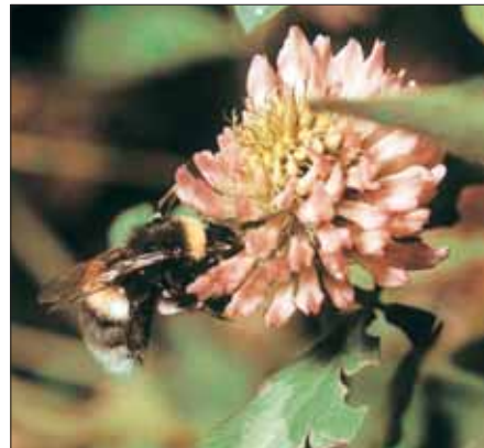
Eine Erdhummel ( Bombus terrestris ) beißt den Rotklee am Blütengrund an, um den Nektar seitlich zu entnehmen.

1957 durch Mitarbeiter der Abteilung Bienenkunde des Instituts für Kleintierzucht der Humboldt-Universität zu Berlin (das waren der Autor und eine Imkergehilfin) auf einem Saatgut im heutigen Land Brandenburg Versuche zur Duftlenkung von Honigbienen durchgeführt. Dazu wurden allabendlich die duft- und nektarhaltigen Einzelblütchen aus 10 frisch gepflückten Blütenköpfen je Bienenvolk gezupft und über Nacht (mindestens 5 Stunden) in eine lauwarmlöse Zuckerwasserlösung (1:1) eingelegt und diese „beduftete“ Lösung (100 ml/Volk) am nächsten Morgen per Futterflasche bzw. im Seitenwandfutterschnecken in die Versuchsvölker eingebracht. Die Kontrollvölker erhielten die gleiche Menge duftloser Zuckerlösung.