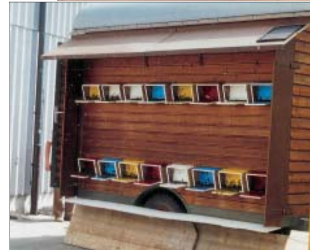
Einachsiger Wanderwagen, mit 16 Hinterbehandlungsbeuten belegt. Die Lichtzuführung erfolgt durch Fenster und Tür.

gung der Völker in Frei-/Wanderständen sind auch hierfür zusätzliche Wirtschaftsgebäude oder sonstige Räumlichkeiten wie bei der Freiaufstellung erforderlich.