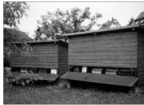
Diese Stände können mit wenigen Handgriffen zerlegt werden, sie sind zudem leicht und eignen sich deshalb auch als Wanderstände. Hier dienen sie der Unterbringung von Jungvölkern im Hausgarten.